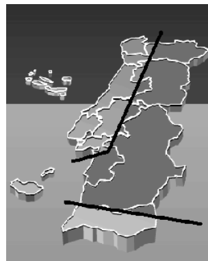
Figura 1. As assimetrias em Portugal

As legendas de figuras e de tabelas devem ser centrados se for menos de uma linha (figura 1), caso contrário, justificados e recuados 0.8cm em ambas as margens, como mostrado na figura 2. A fonte do subtítulo deve ser Calibri, 10 pontos, negrito, com 6 pontos de espaço antes e depois cada subtítulo.